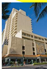
※ミラマー・アット・ワイキキ※