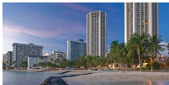
※ハイアットリージェンシー※