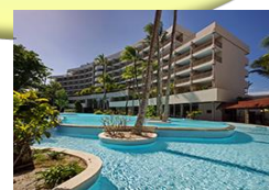
パークホテル (デラックス)